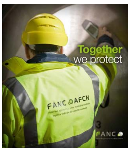
Table ronde - Ronde tafel - 28/02/2019 – Noodprocedure en transportoefening