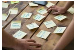
Table ronde - Ronde tafel - 28/02/2019