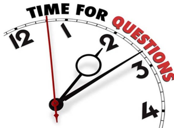
Table ronde - Ronde tafel - 28/02/2019